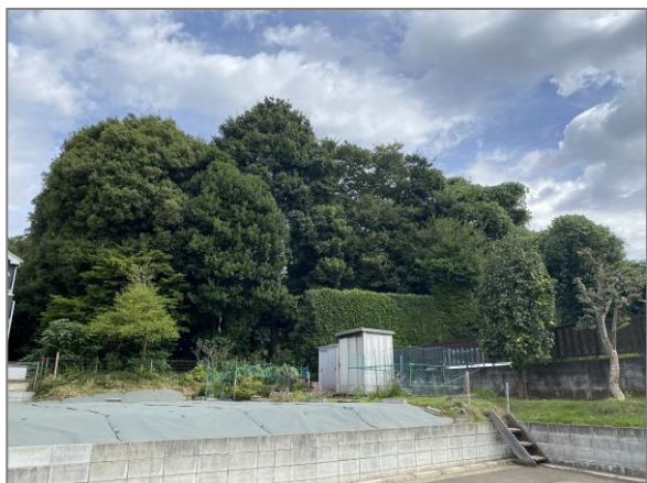
1 緑地保全制度による新規指定 (さちが丘特別緑地保全地区)