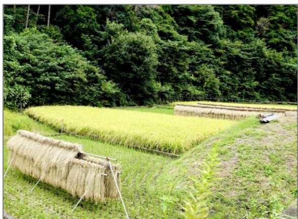
8 水田の保全 (矢指町)