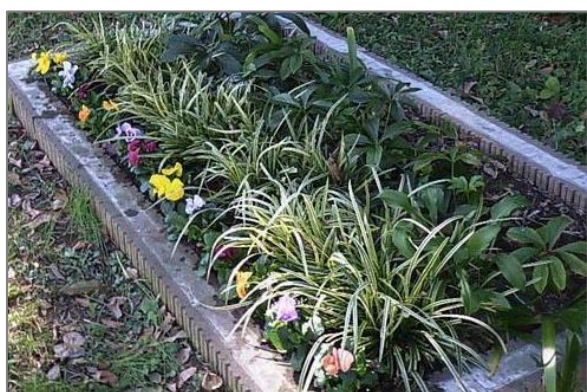
17 公共施設・公有地での緑の創出・育成 (ふるさと尾根道緑道)