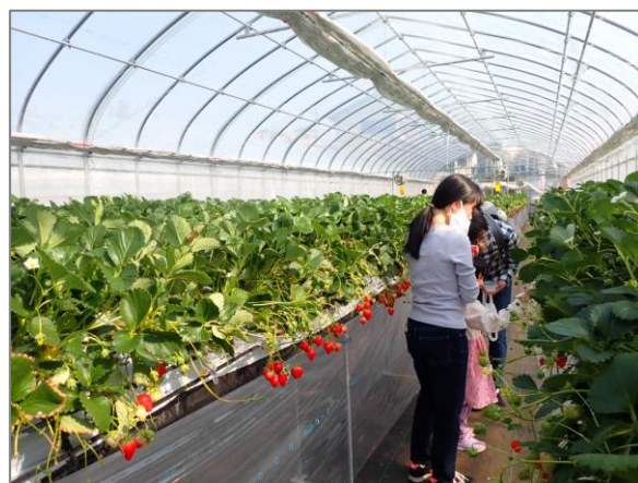
12 収穫体験農園の開設 (今宿一丁目)