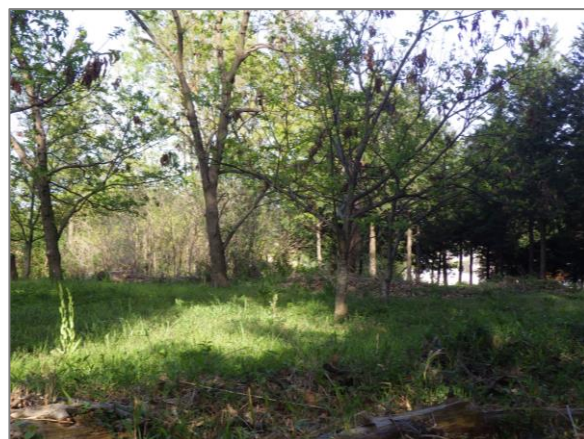
1 緑地保全制度による新規指定 (追分市民の森)