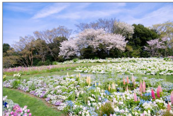
26 都心臨海部等の緑花による魅力ある空間づくり (里山ガーデン)