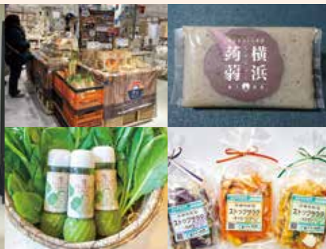
地産地消ビジネス創出支援事業で支援した取組