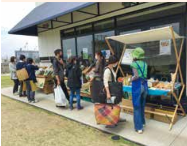
はまふうどコンシェルジュが開催しているマルシェの様子