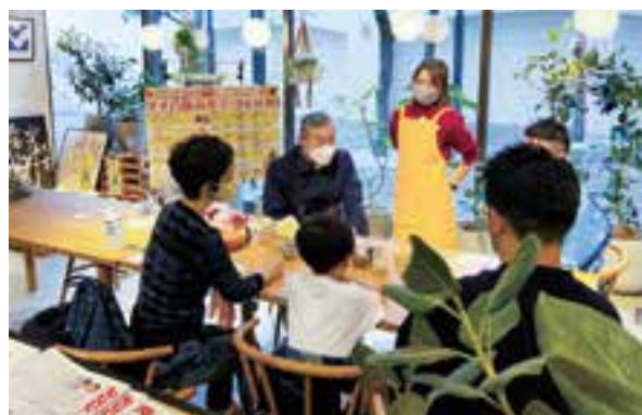
はまふうどコンシェルジュによる地産地消講座