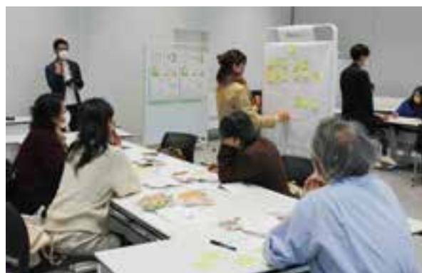
情報交換の場(食と農のフォーラム)