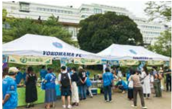
サッカーチームと連携した地産地消イベント