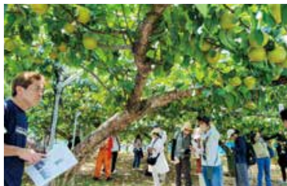
はまふうどコンシェルジュ育成講座

生産者やよこはま地産地消サポート店、はまふうどコンシェルジュ、地産地消に取り組む市民・企業等をつなげる交流会等を開催し、ネットワークづくりを支援します。