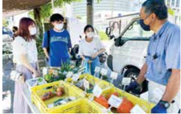
大学と連携した地産地消のPR