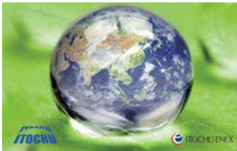
リニューアブルディーゼル