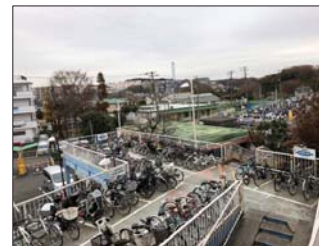
写真 低・未利用な市営住宅跡地