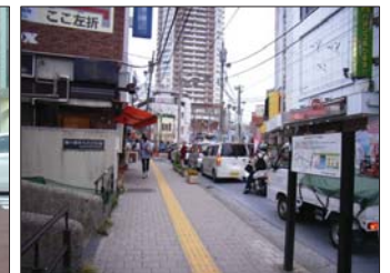
写真 水道道の交通渋滞