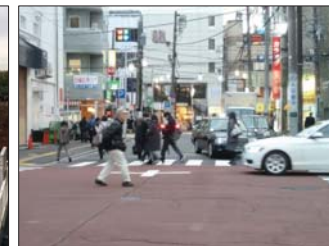
写真 歩行者と自転車、自動車の錯綜状況