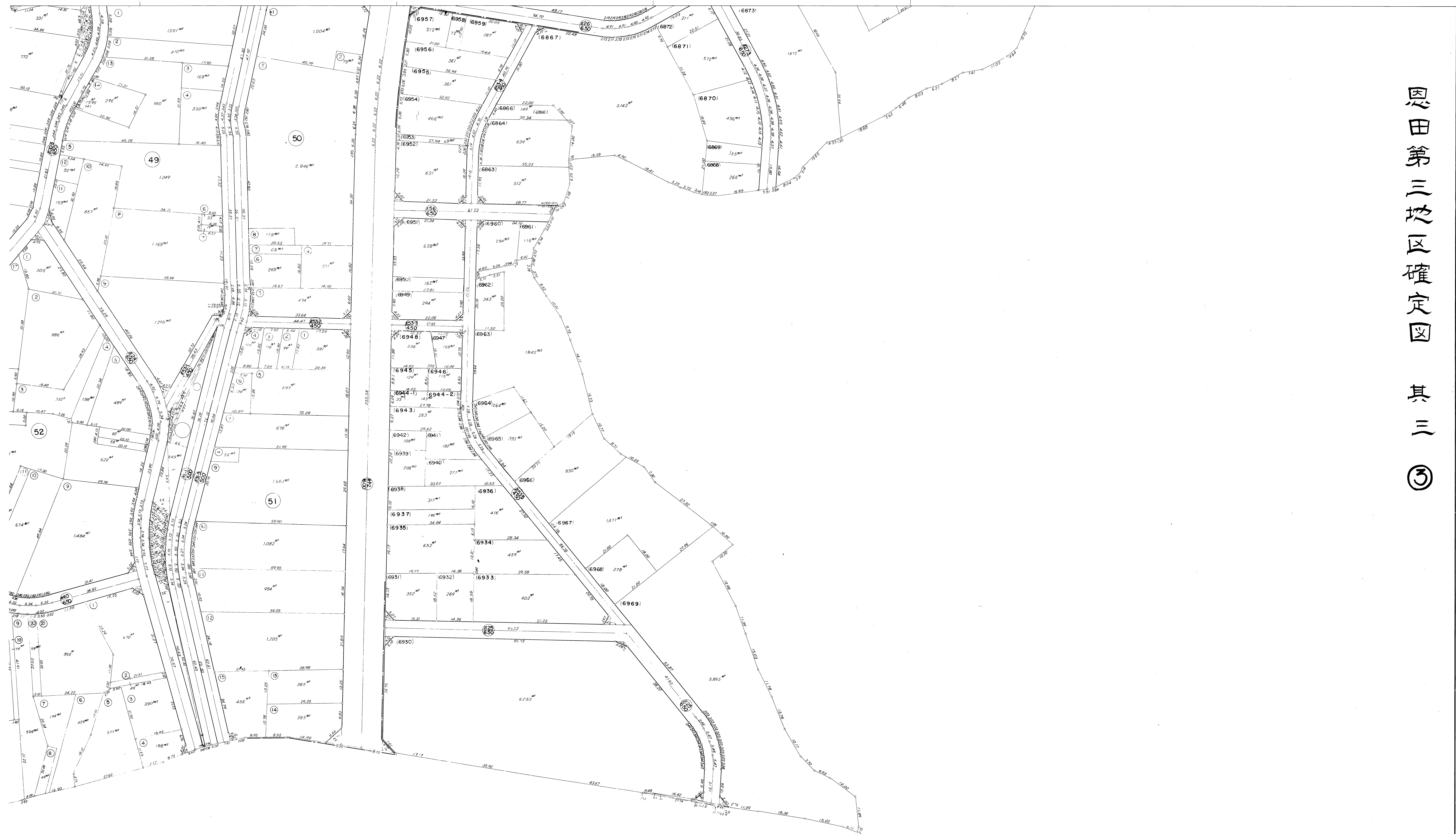
恩田第三地区確定図 其三 ㊸