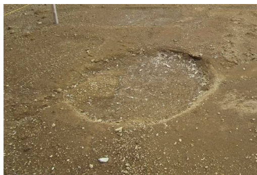
施工不良の状況（基礎杭跡の沈下）

また、この対策工事を進めるにあたって、宅地1のエリアが施工ヤードとなるため、当初12月着工とお知らせしていた、駅前のスロープ工事を延期することとなりました。