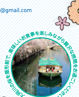
大岡川で屋形船で美味しいお食事を楽しみながら桜の満開をお楽しみください。大岡川で屋形船で美味しいお食事を楽しみながら桜の満開をお楽しみください。