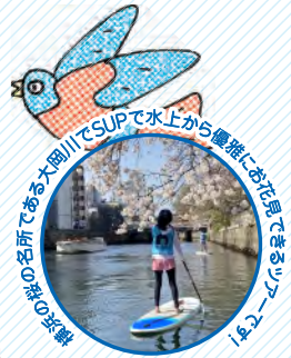
大岡川でSUPで水上から優雅にお花見できるツアー。大岡川の名所である大岡川でSUPで水上から優雅にお花見できるツアー。大岡川の名所である大岡川でSUPで水上から優雅にお花見できるツアー。