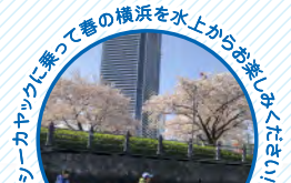
シーカヤックに乗って春の横浜を水上からお楽しみください。

URL: https://www.nippon-maru.or.jp/park-events/seakayak/