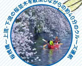
大岡川でEボートで桜の満開をお楽しみください。