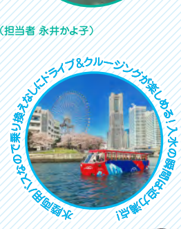
大岡川でスカイダックでお花見をお楽しみください。

企画: 日の丸サンス株式会社 / シティアクセス株式会社 運行: 日の丸自動車興業株式会社