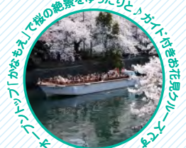
大岡川でフェリーでお花見をお楽しみください。

申し込みページ: http://www.rec-system.co.jp/travel/domestic.html