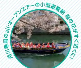
大岡川で小型遊覧船でお花見をお楽しみください。