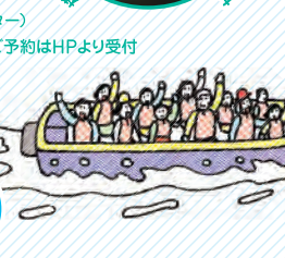
大岡川で水陸クルーズを楽しむ。大岡川で水陸クルーズを楽しむ。大岡川で水陸クルーズを楽しむ。