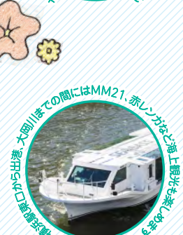
大岡川まで出港、大岡川までの間はMM21、赤レンガなど船上観光を楽しめます。大岡川まで出港、大岡川までの間はMM21、赤レンガなど船上観光を楽しめます。