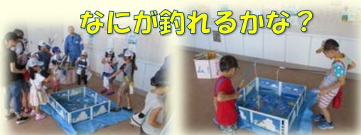
なにが釣れるかな？