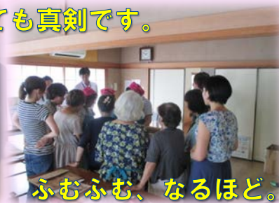
ふむふむ、なるほど。