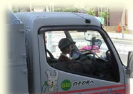
収集車、かっこいいね！