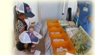
どこに入れようかな？

8月17日(金)、今年も「子どもアドベンチャー」が緑区役所庁舎で行われました。私たち資源循環局緑事務所は緑区役所庁舎前広場で“収集車乗車体験”と“3R夢(スリム)分別釣りゲーム”を出展しました。釣りゲームは釣れた「魚」の裏面に家庭から出る、ごみと資源物が描かれておりそれを正しく分別するゲームです。ほぼ間違えることなく子どもたち皆さん分別が出来ていました。日頃から分別にご理解、ご協力いただいていることがよくわかりました。子どもたちが笑顔で分別釣りゲーム・乗車体験していただけた事が印象的でうれしく思いました。ときおり強風の吹く暑い中、400人近い大勢のご参加をいただきました。ご参加いただいた皆様、ありがとうございました。