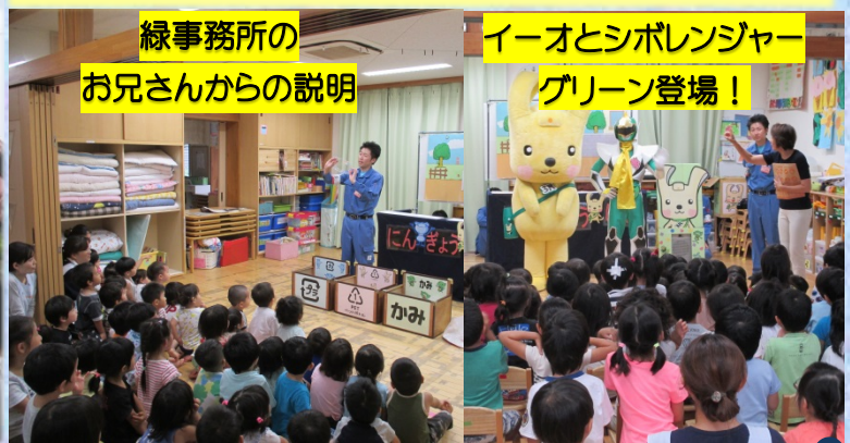
緑事務所の お兄さんからの説明