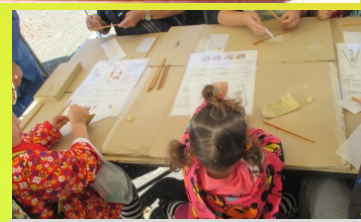
④ 蜜蝋とペーパーで仕上げます

かんばつさい 間伐材を有効利用しています! 森林の樹木の健全な発育を助けるために、成長過程で密集化する立木を計画的に間引くことを「かんばつ」と言います。 「マイ箸」は「かんばつ」を使用しています。「マイ箸」を使用して、使い捨てをなくしましょう!