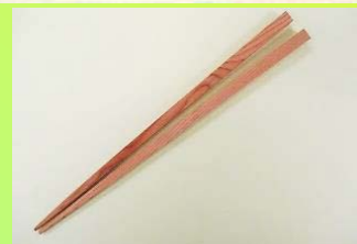
② 箸の長さを選びます