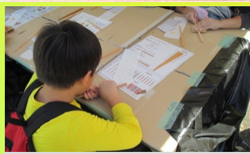
③ 紙やすりで、滑らかに削ります