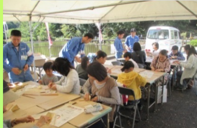
昨年のマイ箸づくりの様子

かんばつさい 間伐材を有効利用しています! 森林の樹木の健全な発育を助けるために、成長過程で密集化する立木を計画的に間引くことを「かんばつ」と言います。 「マイ箸」は「かんばつ」を使用しています。「マイ箸」を使用して、使い捨てをなくしましょう!