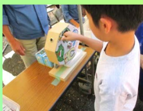
スリム 3R夢クイズに答えて抽選会で景品をゲット!

モザイクアートに参加してみませんか! 食品ロス削減の取り組みの一環として、皆様が書いたメッセージ入りの写真を撮影し、1枚の大きなアート作品をつくりまします。市内公共施設等に掲示予定です。是非ご参加ください!