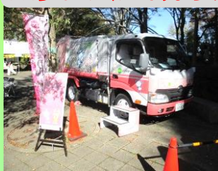
スリム 3R夢カーに乗ってみよう!