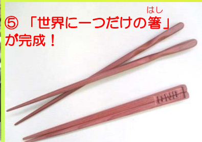
⑤ 「世界に一つだけの箸」が完成!