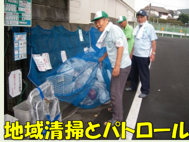
地域清掃とパトロール