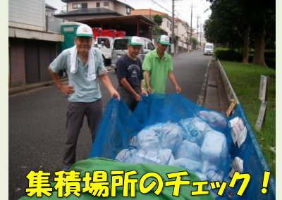
集積場所のチェック!