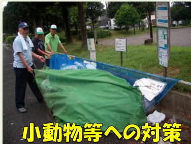
小動物等への対策

今後も緑区がより一層美しく、住みやすい街になるよう取り組んでまいりますので、皆様のご協力をよろしくお願いいたします。