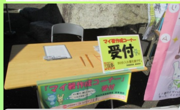
① 受付で、整理券を受け取ります