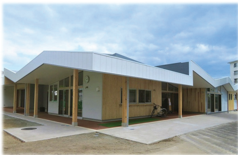
洋光台南第一住宅管理棟