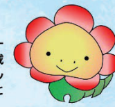
のばなん イメージキャラクター

のば緑彩の会 イメージキャラクターを作成し、地域の皆様に親しみやすい取り組みへとしていきます。