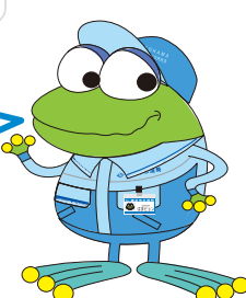
横浜市水道局キャラクター「はまビョン」