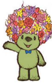
요코하마의 꽃과 녹음을 PR하는 마스코트 캐릭터 '가든 베어'

※신종 코로나 바이러스 감염증의 영향으로 일부 중지 · 축소, 기간 단축으로 개최될 수 있습니다.