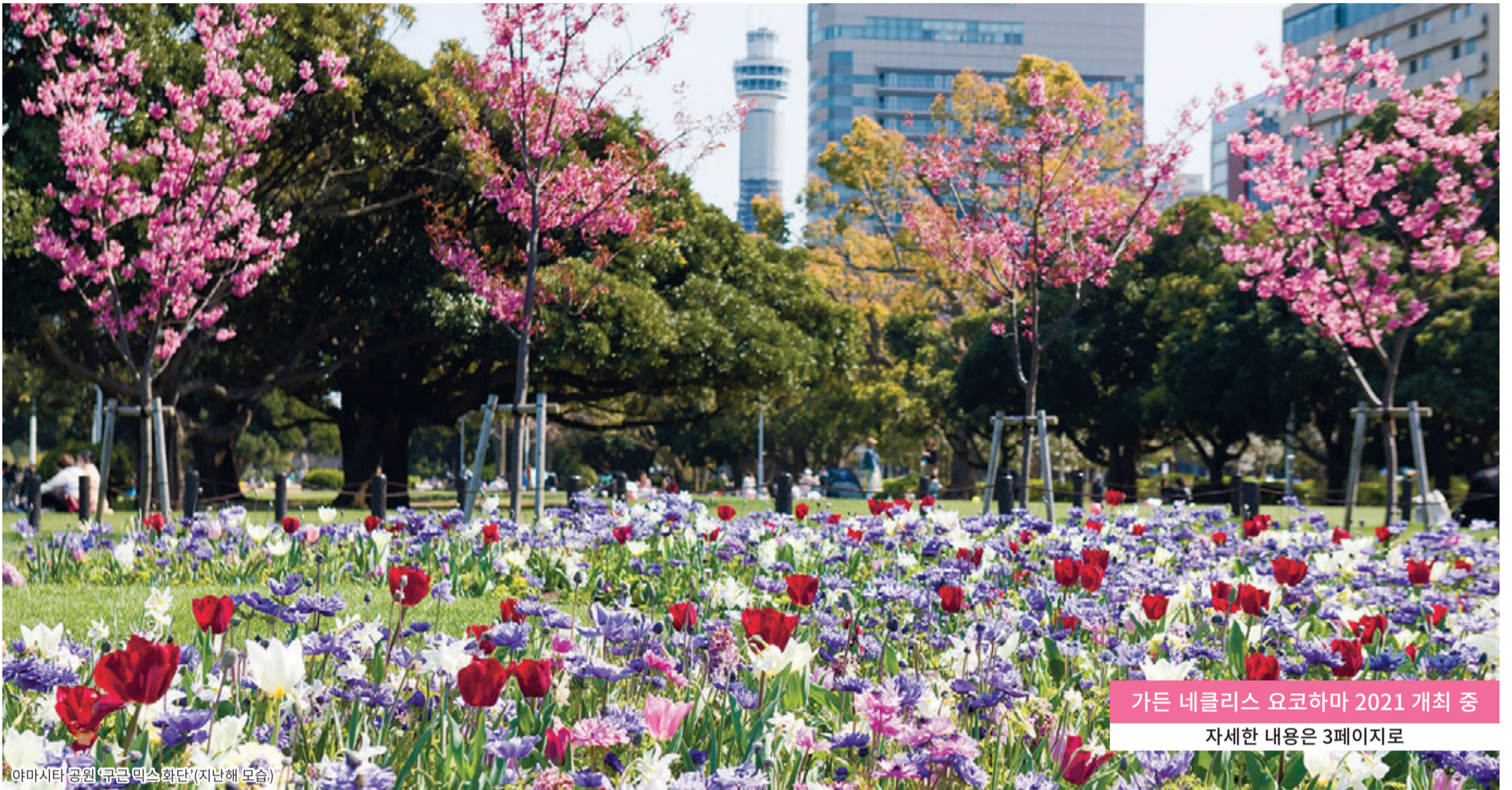
가든 네클리스 요코하마 2021 개최 중