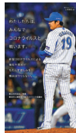
요코하마 DeNA 베이스타즈가 협력하는 인권 계발 포스터

강한 믿음에서 오는 불안에 휘둘리지 말고 올바른 지식과 정보에 근거한 냉정한 행동을 취해 주시기 바랍니다.