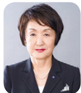
요코하마 시장 하야시 후미코

드디어 본격적인 봄이 되어 거리에서는 벚꽃과 튜립 등의 꽃들이 만발하고, 많은 분들이 새로운 한 걸음을 내딛는 계절을 맞이했습니다. 올해도 3월 27일부터 ‘가든 네클리스 요코하마 2021’을 개최하고 있습니다. 꽃과 녹음에