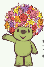
象征吉祥物「花园熊」

从5月上旬开始，将迎来市花的「玫瑰花」的赏花时节。在横滨展各个会场的玫瑰花园，改变赏花主题，符合其主题的各种各样品种的玫瑰花将百花齐放。请您饱尝形形色色的玫瑰花的媲美。