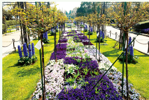
5月份将在步行人的头顶串连玫瑰花的拱圈

由于连接不断的玫瑰花拱圈以及方尖碑 ※ 的立体表演而引人注目。在既有的玫瑰花上增添新玫瑰花和多种多样的花草，重新装饰得五彩缤纷。