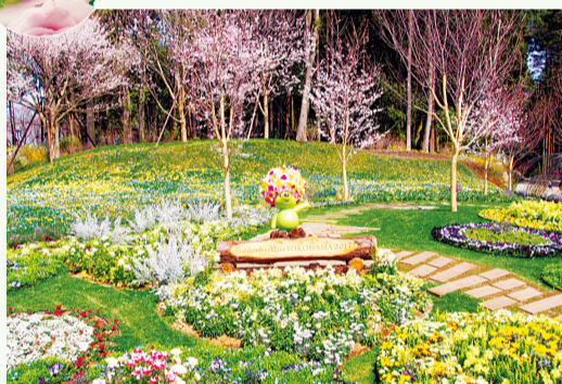
请在花园熊拍摄景点拍纪念照

在公报亲善大使三上真史先生设计的迎宾花园，以三上先生为形象而培植的玫瑰品种「爽」正是赏花时节。