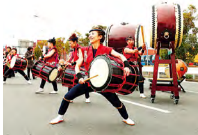
「横滨马拉松2016」供水站行为情景