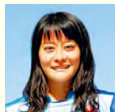
铃木彩香小姐 (女子日本国家队队员)

面向举办 Rugby World Cup 2019™，委任了发出橄榄球以及橄榄球世界杯大赛之魅力的举办城市特别支持者。