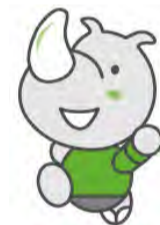
横滨市债吉祥物「滨债」

包括特别会计·企业会计·外围团体的「一般会计对应的贷款余额」，与上一年度底相比谋求 483 亿日元的缩减，达到 3 兆 1,830 亿日元。