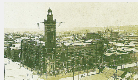
横滨市历史资料室所珍藏资料