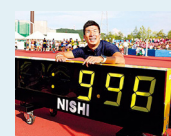
「桐生、9秒98的壮举」 男子田径赛 100米日本人首创 9秒98 记录的桐生祥秀选手(2017年9月9日,福井运动公园田径比赛场)