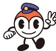
市营交通形象吉祥物「Hamarin」