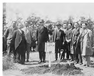
种植西雅图玫瑰的情形