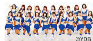
作为讲师，横滨DeNA BayStars官方表演队Diana也将出场。

【关于报名的咨询】执行委员会（文化观光局内） 电话：045-663-1365 传真：045-663-1928