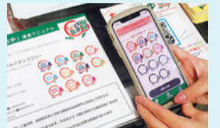
手机盖章健走活动(2020年12月開催)▶

2020年12月在港北区，活用国家推动的“GoTo商店街事业”，采取疫情对策的同时，举办了在身边的商店轻松购物的非接触手机盖章健走活动，有区内11条商店街参加。