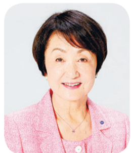
横滨市长 林 文子

今春，港未来 21 地区将更加兴旺热闹，神奈川大学的新校舍正式启用，缆车开始运行等。春秋两季将分别举办“Garden Necklace 横滨”，鲜花绿树引导我们通向 2027 年举办国际园艺博览会。同时，“东京 2020 奥运会·残奥会”及“Dance Dance Dance @ YOKOHAMA 2021（暂称）”准备工作也在顺利进行。我们还致力于关内和关外地区的城市建设，以及振兴活跃郊区经济。另外，积极研究实施为实现支撑未来经济成长的国家项目 IR（综合型度假胜地）的各项工 作，整备新剧场等，展开充满魅力的城市建设，为保证横滨的持续性发展铺平道路。