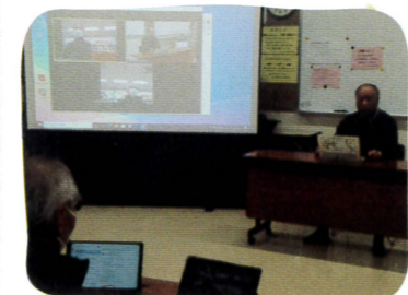
▲リモート会議の練習風景