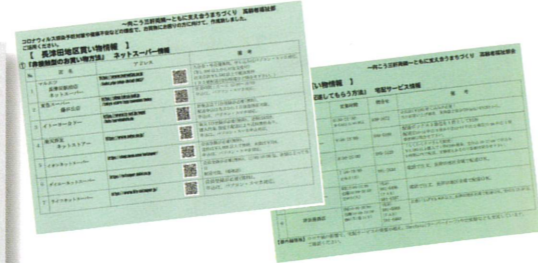
▲長津田地区買い物情報 向こう三軒両隣ともに支え合うまちづくり (高齢者福祉部会)