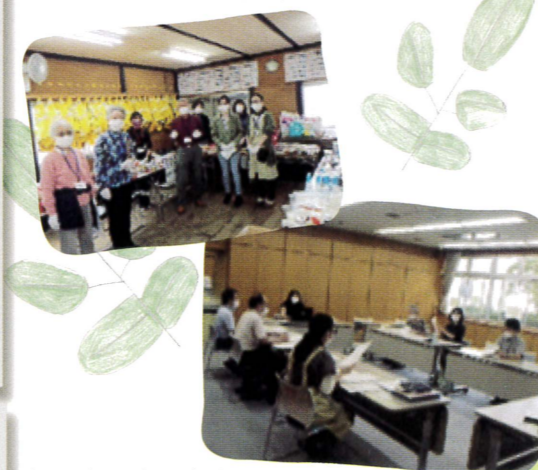
▲長津田地区食支援 【令和2年度実施に協力していただいた ボランティアの皆さん(左)】 【令和3年度実施に向けた話し合い(右)】