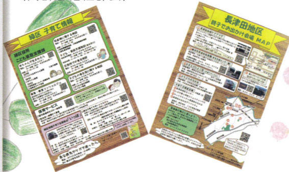
▲長津田地区子育て情報 &親子でお出かけ会場MAP 向こう三軒両隣ともに支え合うまちづくり (こども・子育て部会)