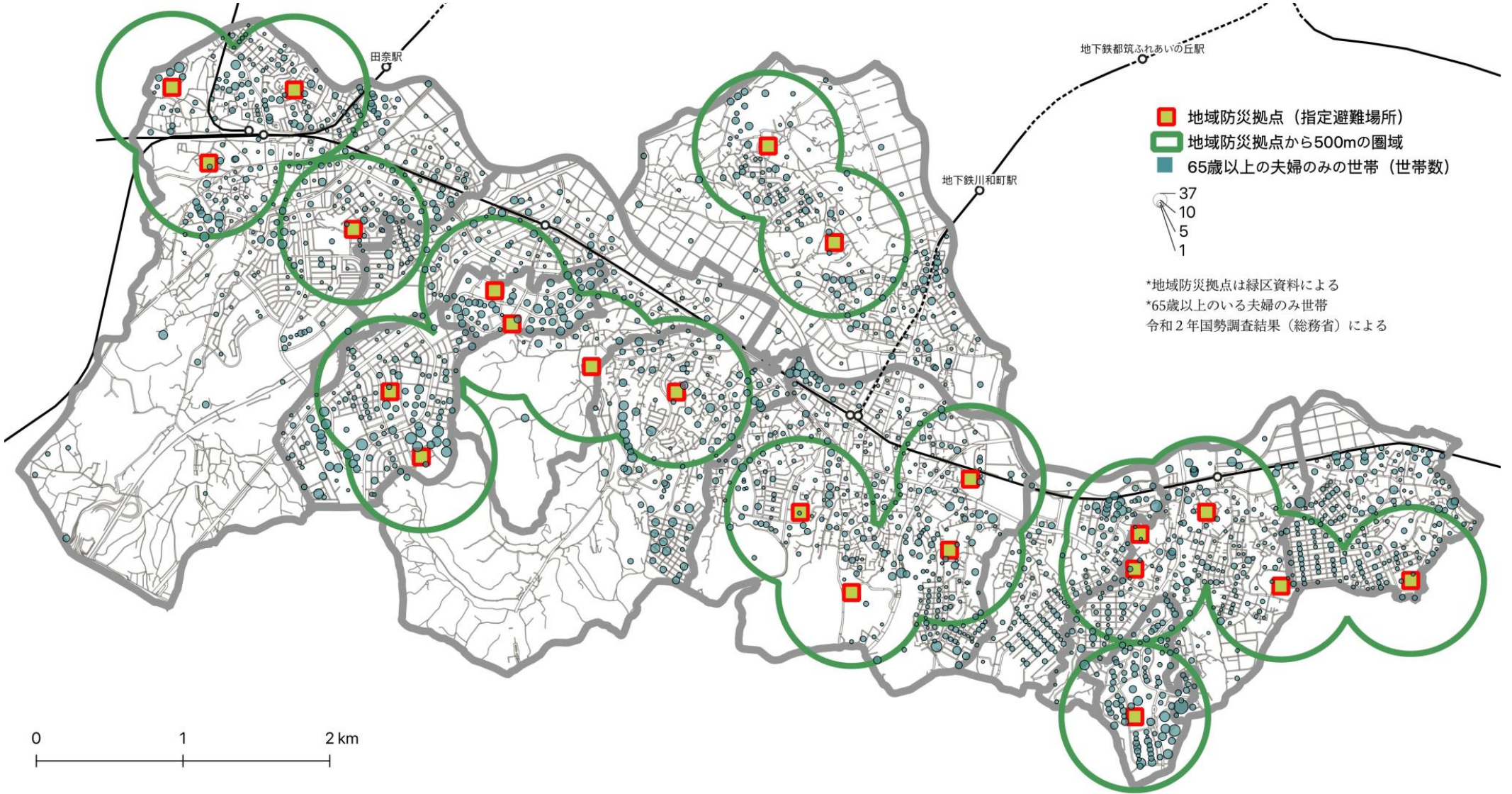
図 65歳以上のいる夫婦のみ世帯と地域防災拠点