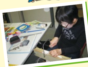
修理ボランティアさん

※緑図書館の事業は、修理ボランティアさんや読み聞かせボランティアさんのかつやくに支えられています。