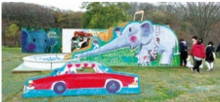
▲一昨年のズーラシアガーデンパーティー

ズーラシアガーデンパーティー ☎3月27日(土)~4月4日(日) 📍ころこロッジほか 📍