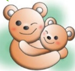
緑図書館キャラクター「ぶっくまおやこ」