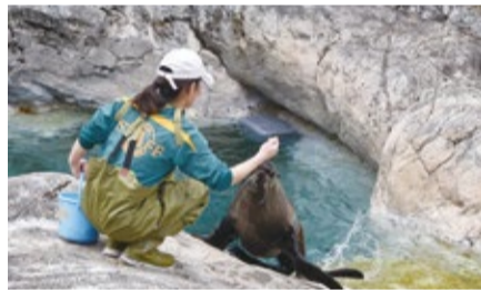
▲運動場に出る練習中