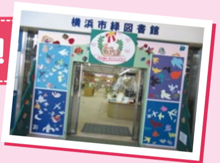
▲横浜創英大学とのコラボレーションによる図書館入口モニュメント「飛ぶ鳥を表す身体表現から空間表現へ」

緑図書館は、十日市場駅から徒歩4分。 皆さんが本に親しめるようにさまざまなお手伝いをしているよ。ぜひ来てね!