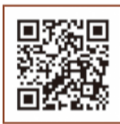
▲みどりっこひろば