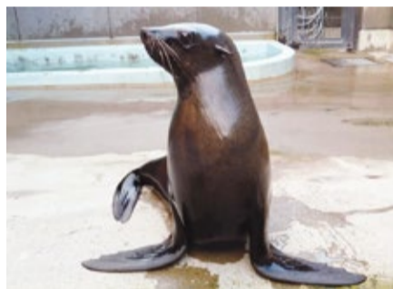
▲「王」の由来是北京オリンピック

令和2年11月には鳥羽水族館から「ワン」(推定12歳・雌)が来園しました。初めて運動場に出る練習をしたときはそのまま2日間も寝室に帰ってこなくなり、ずいぶん心配しました。水量約400tの広いプールでのびのび泳ぎたかったのかもかもしれません。ワンは細い見かけによらず、野太く「オアァッ!」と鳴きます。たくましい鳴き声にも注目してください。