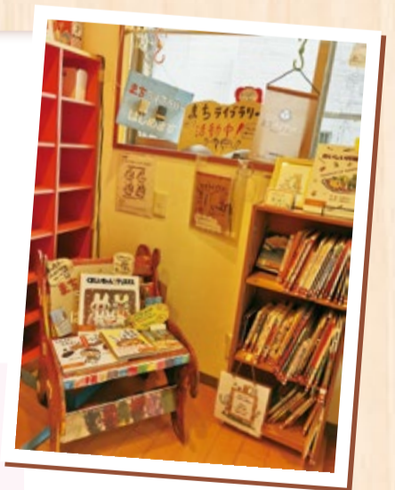
緑区地域子育て支援拠点「いっぽ」の「まちライブラリー」