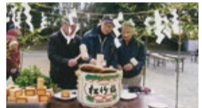
▲鏡割り(餅つき大会)