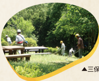
▲三保市民の森愛護会

緑区の豊かな自然を愛する人たちが、水辺愛護会、市民の森愛護会となって継続的に水辺や森を清掃・除草しており、とてもきれいに維持されています。