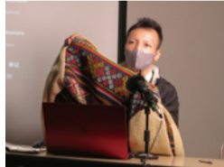
▲故郷の織物の模様を見せながら