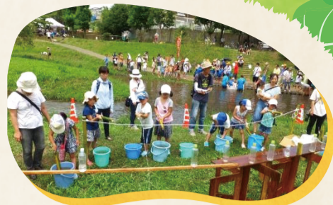
▲「こども川の日」 水鉄砲で遊ぶ子どもたち (梅田川水辺の楽校協議会主催)

農家で余ったキャベツの葉をもらい、水路に置いてカワニナ(ホタルの餌)の餌にしている(新治谷戸田を守る会)