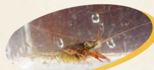
▲アメリカザリガニ

コイ、ウシガエル、アメリカザリガニ、ミシシippアカミガメ(ミドリガメ)などの外来種も増えており、環境への悪影響が懸念されています。