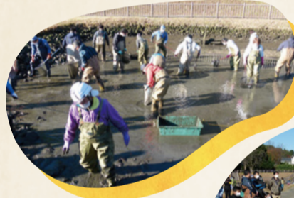
◀生き物捕獲の状況 (2021年)

【主な在来種 (希少なものの)】 ホトケドジョウ、 アブラハヤ、 ヌカエビ、モツゴ 【国内外来種】 フナ属、オイカワ、 タモロコ