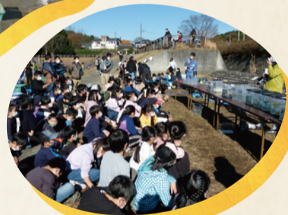
捕獲した生き物の 説明に耳を 傾ける子どもたち

※池から水を抜き、一定期間干して、清掃や池の破損箇所の点検等の作業をすることです。最近では池の水質改善や在来種保全を目的に行われる例が増えています。