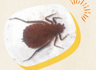
▲コオニヤンマのヤゴ(幼虫)

区内には、自然豊かな池や田んぼ、川が多くあり、多種多様なトンボ、ヤゴ(トンボの幼虫)、カエルが生息しています。