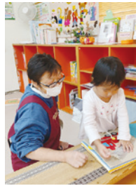
▲いっぽひろばで子どもを預かっている様子