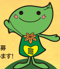
▲緑区キャラクター「ミドリ」