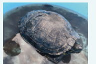
ミシシッピアカミミガメ

生き物観察会を通して、地域の人たちや小学生が、生物多様性の保全の大切さについて考えるきっかけとなりました。