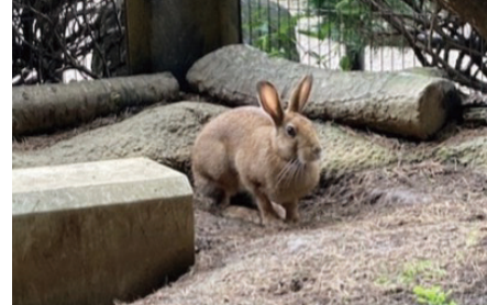
▲地面の土と同じ褐色の体毛

トウホクノウサギはニホンノウサギの亜 種の一つで東北地方から本州の日本 海側に生息しています。主に夜に活動 し、野生では昼間はやぶの中などで過 ごし、ズーラシアで生活している個体 も日中は隅の方でじっとしていること が多いです。これは、野生だと天敵で ある大型の鳥類やキツネなどに襲われ ても抵抗する術を持たないノウサギに とって、隠れるという最大の天敵対策 でもあります。この対策の効果をより高 めるため、トウホクノウサギの体毛は耳 の先を除き、夏になるにつれて褐色に、 冬になるにつれて白色に変化します。 地面の土の色と積もった雪の色に紛れ ることじっと動かないノウサギを周 囲の景色に溶け込ませ、より見つけ にくくするのに一役買っています。