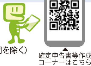
確定申告書等作成コーナーはこちら