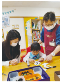
▲作業している子どもを見守る母親とサポート会員