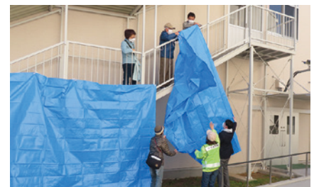
地域防災拠点でのペットの飼育場所設営 (三保小学校地域防災拠点訓練にて)

*緑区には7,464頭の犬の登録があります。横浜市防災計画では元禄型関東地震と同規模の地震が発生した場合、緑区の5.4%の方が避難すると推計されており、犬も同じ割合が避難すると区内で403頭と試算されます。