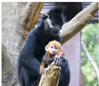
▲母のユズと一緒にいるポンズ

フランソワルトンはベトナム北部から中国南部の河川に面した石灰山地や険しい岩山のある熱帯モンスーン林に生息しています。中国では伝統的な薬になるといわれおり、密猟されていることなどが原因で絶滅危惧種に指定されています。