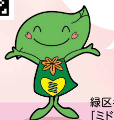
緑区キャラクター「ミドリん」