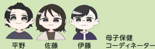
母子保健コーディネーター