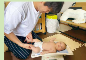
母子訪問中の父親と赤ちゃん

初めて赤ちゃんを出産した人が対象です(第2子以降でも不安な人は相談可能)。助産師・保健師が生後2か月ごろに訪問し、赤ちゃんの体重測定や、授乳・育児の相談ができます。