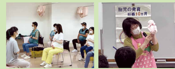
母親(両親)教室の様子