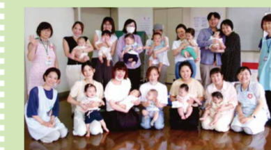
赤ちゃん教室の様子