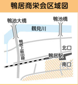
鴨居商栄会区域図

新型コロナウイルス感染状況も徐々に落ち着き、次第に街も活気が戻りつつあります。今春には鴨居商栄会最大のイベント「第8回鴨居桜まつり」を4年ぶりに開催することができました。また、鴨居の新たなイベントとして定着しつつある冬の風物詩、鴨居駅前にて開催の「カモイルミネーション」など地域活性化をテーマにした多様なイベントを行っています。鴨居駅周辺を拠点とする鴨居商栄会は昔ながらの老舗もあり、和やかな時間を過ごすことができます。お近くにお越しの際はぜひお立ち寄りください。