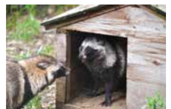
▲小豆が茶豆に怒ることも…