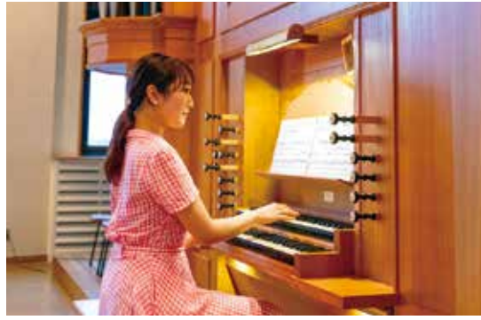
東洋英和女学院大学