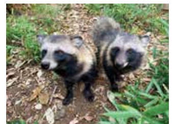
▲左が茶豆、右が小豆。 いつも一緒にいます

ホンドタヌキ ホンドタヌキは、本州および四国・九州 に生息している日本固有種のタヌキで す。ちなみに、東アジアには他の種のタ ヌキが生息しています。日本ではなじ みのある動物ですが、世界的に見ると 珍しい動物です。タヌキには決まった 場所でふんをする「ためふん」という習 性があるのも大きな特徴です。 ズーラシアでは2頭のホンドタヌキを 展示しています。オスの「茶豆」とメスの 「小豆」はとても仲が良く、いつも一緒 に行動をしています。しかし餌の時間にな ると、茶豆が食べるスピードが速す ぎるので、小豆の餌を横取りしてしま います。そのため、餌は部屋を分けて与 えています。展示場で時々おやつを与 える時は、部屋を分けることができない のでいつも争奪戦となります。