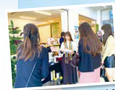
大学の文化祭で結果を報告しました。逗子海岸のビーチクリーンにも参加しました。

7月～10月、大学生が日常生活の中で触れたり、利用したプラスチック製品を数える「プラスチックカウント」や、プラスチックごみを減らす活動に挑戦し、SNSでの情報発信を行いました。