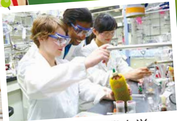
東京工業大学 Tokyo Institute of Technology