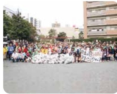
オール井土ヶ谷ふれあいフリーン&ウォーク