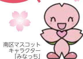
南区マスコット キャラクター 「みなっち」