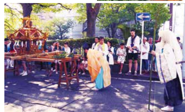
住吉神社・例大祭