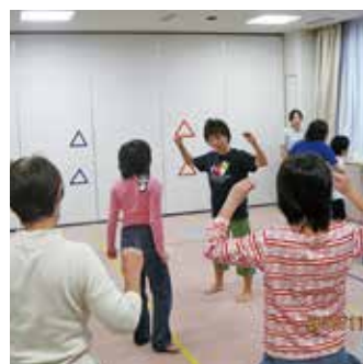
大岡地域ケアプラザ障害児余暇支援事業「サンサンクラブ体操教室」