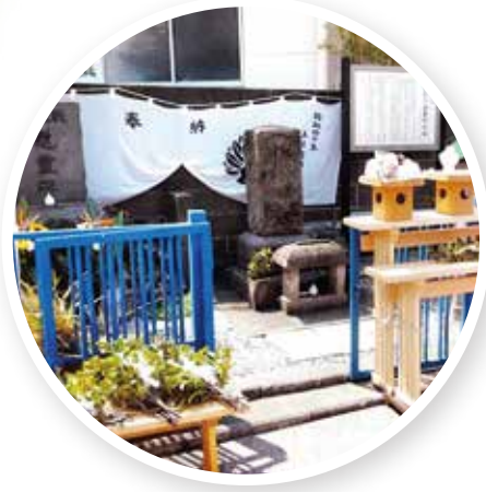
庚申塚(井土ヶ谷事件の跡)★