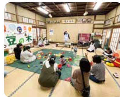
子育てサロン「豆の木」