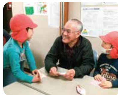
高齢者の居場所「幸助」