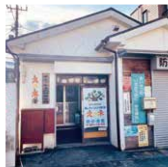
親子のつどいの広場「えの木」