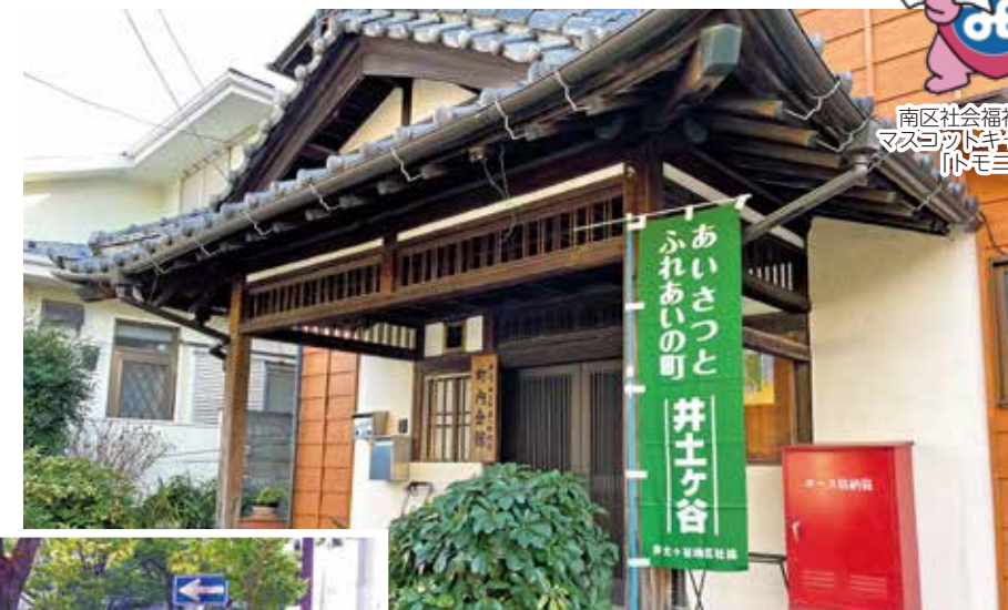
井土ヶ谷上町第一町内会館