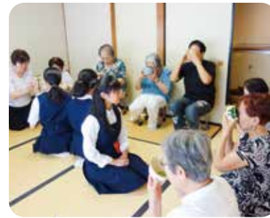
南中学校・蒔田中学校の茶道部との交流会