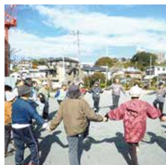
元気づくりステーション「下の前げんき会」