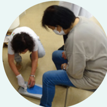
▲地域で健康チェックをするために、健康機器の取り扱いについて研修を受けます