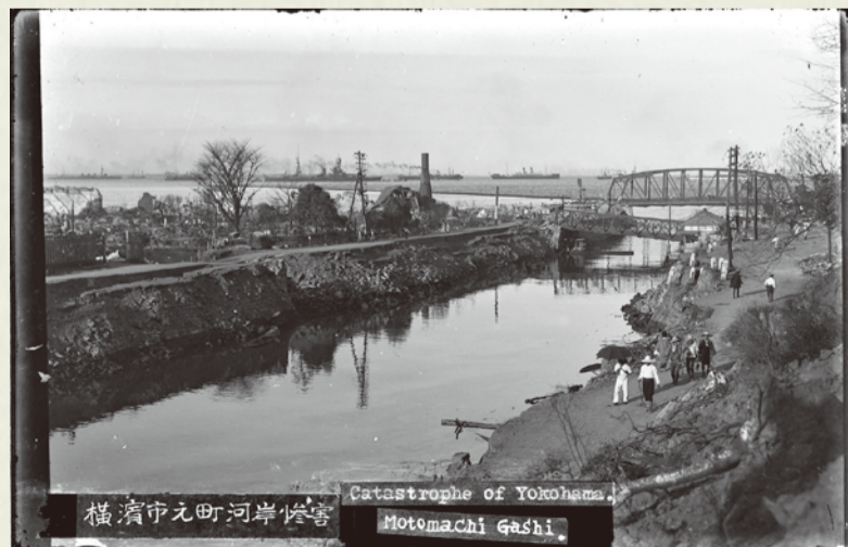
▲横浜市元町河岸惨害 1923(大正12)年9月

河口部、手前の谷戸橋は元町側が落下しているが、その後方、山下橋は健在である。1922年に完成した山下橋は旧大江橋の鉄材を再利用して架けられた。橋の上では通行人のほか、馬の姿も確認できる。また、山下町側には自動車も停車しており、その後ろにはタグボートも停泊している。新港埠頭や大棧橋の