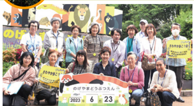
▲第3地区の保健活動推進員と参加者のみなさん

保健活動推進員12人が当番制で年に4回、地域の人に参加を呼びかけてウォーキングをしています。地元の歴史散策や季節の花の鑑賞など、毎回異なるテーマを決めて元気に活動しています。