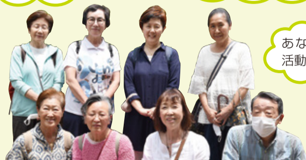
▲6月23日の活動に参加した保健活動推進員