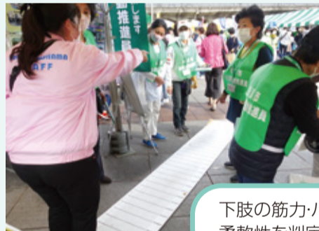
▲2ステップテストの様子

中区民祭り「ハローよこはま」と同時開催の元気フェスタ21で、健康チェックを実施しています。令和4年は握力測定と2ステップテスト(歩幅測定)を行いました。今年も実施する予定ですので、「中区保健活動推進員会ブース」へぜひお立ち寄りください!