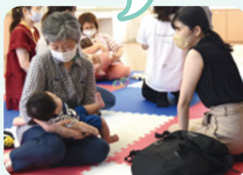
▲赤ちゃん教室のお手伝い

会場の準備をしたり、保健師さんと一緒に赤ちゃんを見守ったりしています。元気いっぱいな赤ちゃんを見ると、こちらも元気をもらえます!