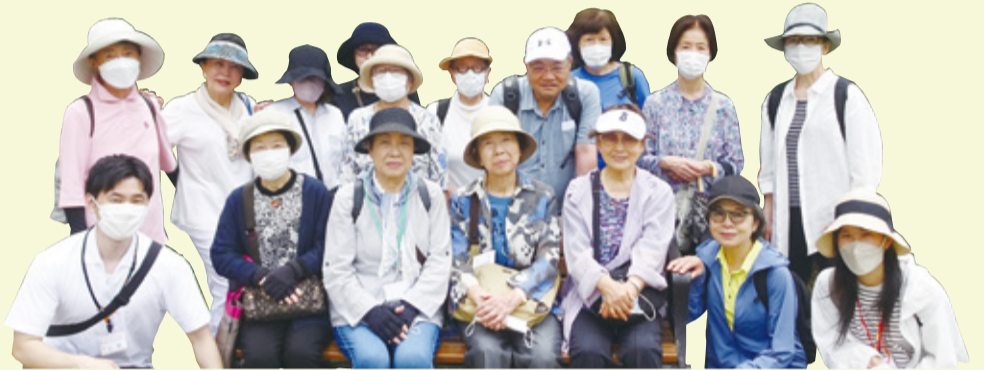
▲埋地地区の保健活動推進員と参加者のみなさん