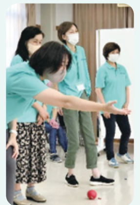
▲地域でポッチャをするために練習中!