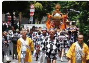
浅間神社 洲崎大神 例大祭