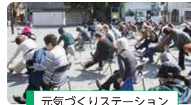
元気づくりステーション 「お茶の間会」拡大実施