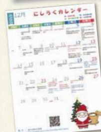
にしろくカレンダー