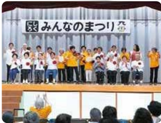
第六地区 みんなのまつり