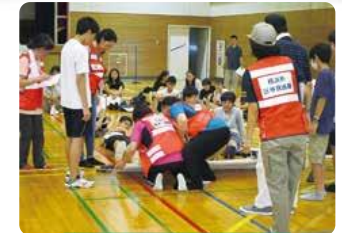
防災訓練（軽井沢中学校）