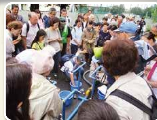
地域防災拠点訓練 浅間台小学校