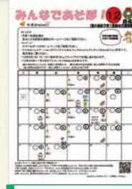
子育て総合カレンダー「みんなであそぼ!」