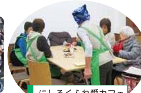
にしろくふれ愛カフェ