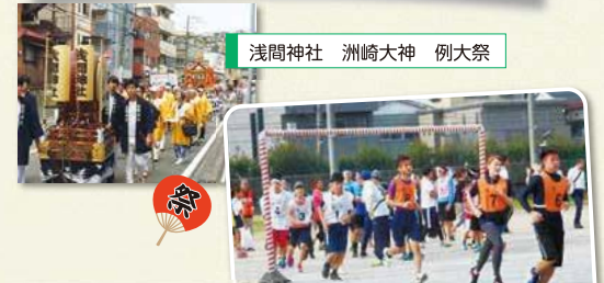
浅間神社 洲崎大神 例大祭