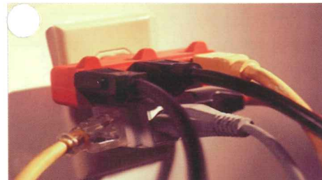
火災の危険性が高い「たこ足配線」