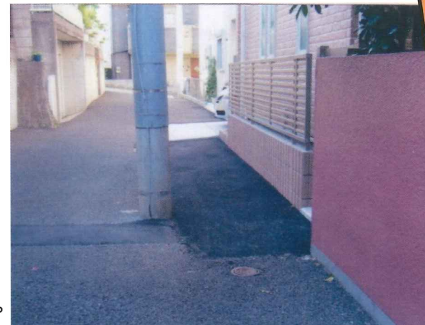
民地セットバック後の電柱