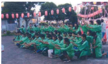
「地域もりあげ隊」のメンバー

これに先立ち8月2日には、岩井原中学生「地域もりあげ隊」の皆さんによるブラスバンド演奏や“よさこい踊り”を池ノ上公園にて行い、祭り前日を盛り上げて頂きました。