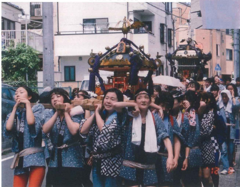
女御輿、缶御輿2連基

8月5日の日曜日午前中は、子供たちの「山車」と「御輿」が、午後は大人の方達が御輿を担いで町内を回り、一日中楽しみました。