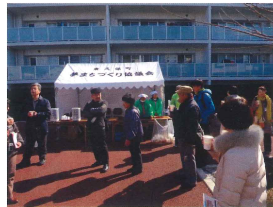
マンション自由広場(甘酒休憩)