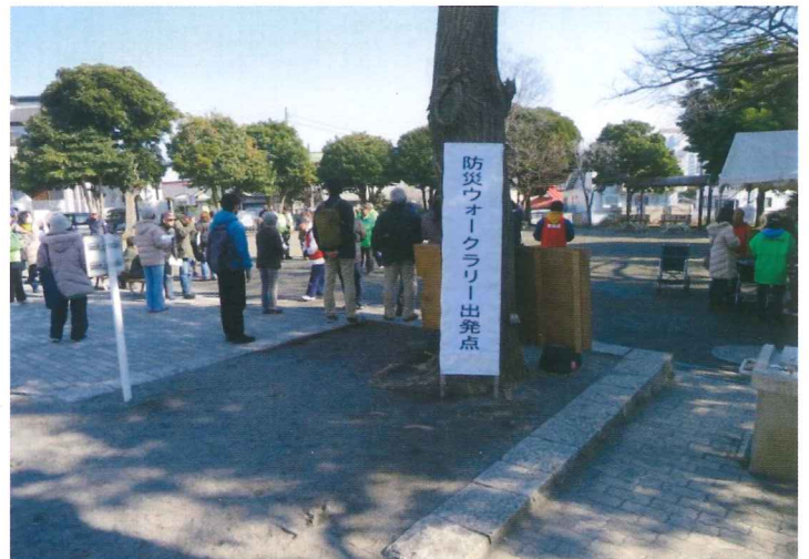
◎ウォークラリー出発点の様子