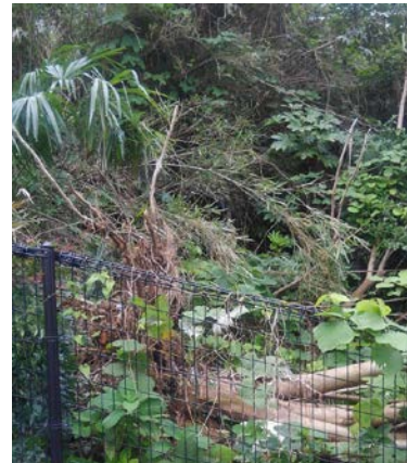
緑地内で根こそぎ倒された木

折れた木は市土木により 伐採されました しかしまだ倒れたままで 放置されている倒木や 折れてぶら下がる太い枝は 多く見られます