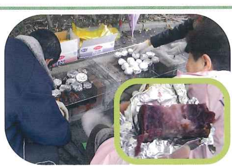
かまどベンチでほくほくの焼き芋ができました。