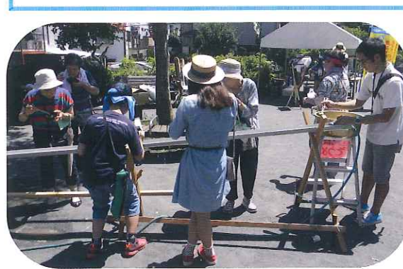
炎天下には、かき氷！冷えたスイカもできました。