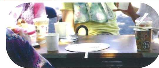
ケリーケトルで沸かしたお湯でカップラーメンを食べました。