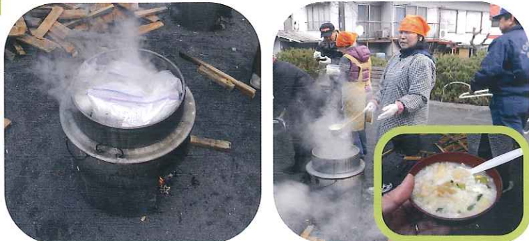
パスタはあらかじめジップロック内で水に浸しておきます。(90分～)1分ゆでると食べられます。