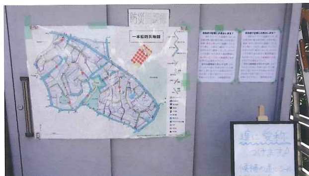
7月19日に西戸部公園で開催された防災カステップUPキャンプでのアンケートの様子