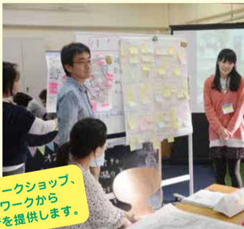
参加型ワークショップ形式で学びの共有