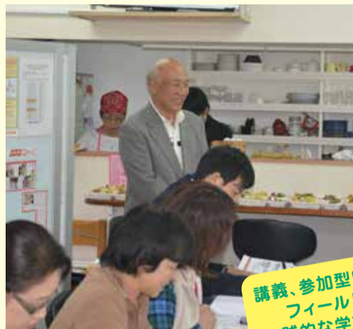
地域づくりの現場を訪問!

「居場所づくり」というと、拠点の立ち上げや、その方法(サロン、食堂など)が思い浮かぶかもしれませんが。西区地域づくり大学校では、「また来たくなる居場所ってどんなところだろう?」、「場と場所の違いは?」などを考えるところから「居場所づくり」を始めます。自分の思いを地域につなげる方法を一緒に考えてみませんか。