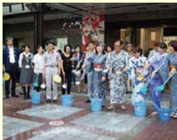
昨年度の様子(横浜駅西口)