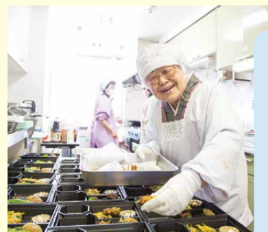
ひとり暮らし高齢者にお弁当を届ける活動を20年以上続ける「西・ともしび」

「フードドライブ(食料運動)」とは、食べられるのにさまざまな理由で処分されてしまう食材を、必要としている人や団体に届ける活動です。今後も定期的に食材を募集しますので、企業や地域の皆さん、ご協力をお願いします。