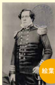
絵葉書 北米合衆国水師提督ペルリ