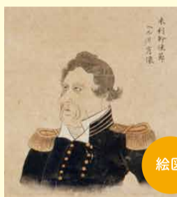
絵図 米国使節の肖像