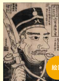
絵図 北亞墨利加洪和政治洲上官真像之写