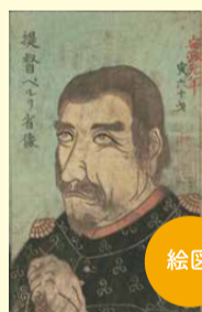
絵図 提督ペルリ省像 他