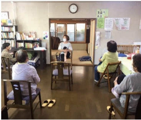
サロンでの体操(予約制で実施中)

ばあばの家 あさだは今年で10年を迎えます。世代を超えた皆の居場所として、健康マージャンや食事会などを行っていました。コロナ禍で休止後7月から再開し、感染症予防に配慮しながら、体操を中心に脳トレにも取り組んでいます。新たにガーデニングサロンを始め、皆で日光を浴び、無心で土をいじっています。今後は、タブレットを使ったゲームなども行います。地域の皆さまと、心地いい居場所をつくっていければと願っています。