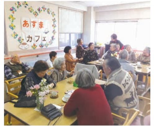
カフェの様子(現在休止中・再開時期は未定です)

平成30年「特別な人がいるわけでもなく、特別でもない場所」として、生駒医院から場所の提供を受けて活動を始めました。雨の日も風の日も常に30人以上が集まり、好きな飲み物を飲みながら悩みを共有し、いろいろなイベントで盛り上がっていました。現在、感染症予防のため活動を自粛していますが、安心・安全な再開に向け、スタッフで話し合いを進めています。見守り活動やあいさつ・声かけなどを通して、認知症の方やそのご家族、そして地域の高齢者が孤立しないよう、地域と繋がり続けていくことの大切さを感じています。