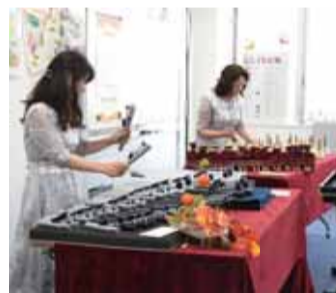
③「Th's ファンタジー」 ハンドベル演奏