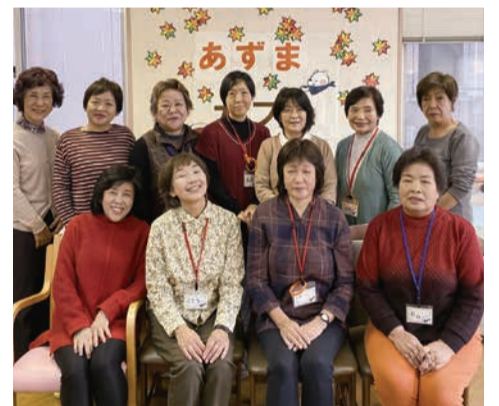
いつもの合言葉「待ち合わせはカフェで」

平成30年「特別な人がいるわけでもなく、特別でもない場所」として、生駒医院から場所の提供を受けて活動を始めました。雨の日も風の日も常に30人以上が集まり、好きな飲み物を飲みながら悩みを共有し、いろいろなイベントで盛り上がっていました。現在、感染症予防のため活動を自粛していますが、安心・安全な再開に向け、スタッフで話し合いを進めています。見守り活動やあいさつ・声かけなどを通して、認知症の方やそのご家族、そして地域の高齢者が孤立しないよう、地域と繋がり続けていくことの大切さを感じています。