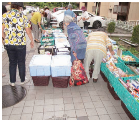
スーパーと福祉会の連携支援で、売上は日本一に

高齢化に危機を感じた住民が集まり、自治会援助のもと平成28年に「福祉会」を結成しました。活動目標は「高齢者の見守り」と「住民の生活支援」です。住民の声から始めた移動販売は、緊急事態宣言の中、住民の生活の糧となり、交流の場となっていました。荷物を運ぶのが大変な方には、スーパーと連携して支援しています。更に取組を広げ、粗大ごみの収集を通して、高齢者の困りごとを聞ければと考えています。これからもアイデアを豊かに、笑顔の輪を広げていきたいと思っています。