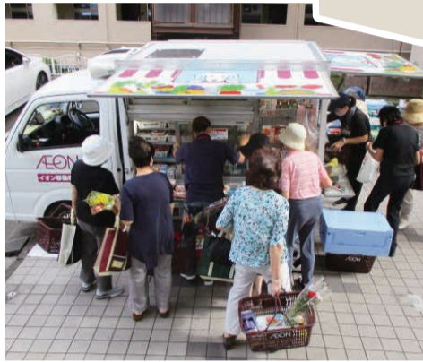
毎週金曜の移動販売

高齢化に危機を感じた住民が集まり、自治会援助のもと平成28年に「福祉会」を結成しました。活動目標は「高齢者の見守り」と「住民の生活支援」です。住民の声から始めた移動販売は、緊急事態宣言の中、住民の生活の糧となり、交流の場となっていました。荷物を運ぶのが大変な方には、スーパーと連携して支援しています。更に取組を広げ、粗大ごみの収集を通して、高齢者の困りごとを聞ければと考えています。これからもアイデアを豊かに、笑顔の輪を広げていきたいと思っています。