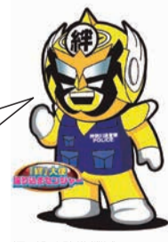
振り込め詐欺撲滅ヒーロー「絆」大使 振り込めセンジャー

その1「急にお金が必要」「キャッシュカードを預かります」こんな言葉を電話で聞いたらサギだ! すぐに電話を切って、警察に通報しよう! その2 留守番電話や迷惑電話防止機器などを設置しよう!