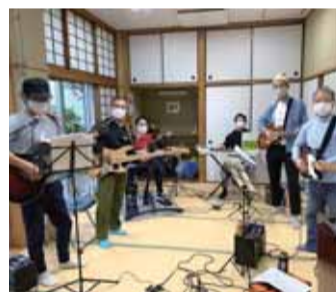
①「モノリス」 バンド演奏

西区では、コロナ禍でもダンスや音楽などさまざまな団体が活発に活動しています。今回、プロジェクトの一環として、練習の成果動画をYouTubeで公開します。ぜひご覧ください。