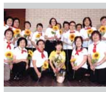
④コーラス「アンダンテ」 手話と合唱