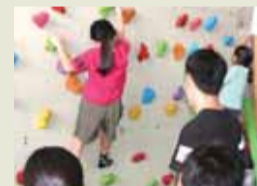
ボルダリング体験