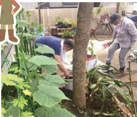
野菜は実りを迎えつつ、ドクダミに苦戦中