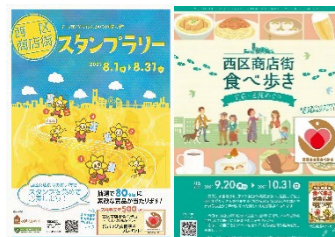
スタンプラリー・食べ歩き冊子