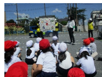
交通安全・防犯教室の開催