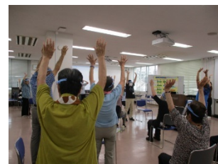
「おげんき活動応援団」の活動