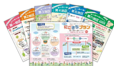
第4期計画概要版・地区別計画リーフレット