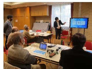
地域の ICT 講習会の開催