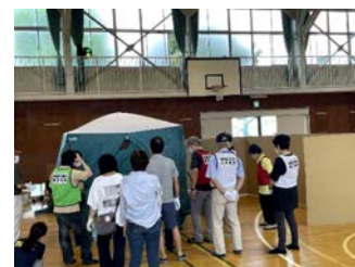
地域防災拠点での訓練