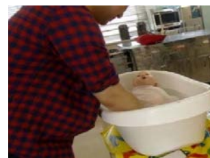
プレパママクラスの様子