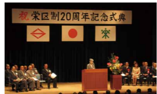
栄区制20周年記念式典