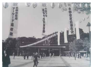
本郷台駅前(1986年当時)