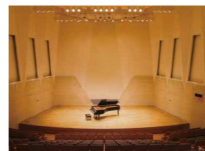
栄区民文化センター「リリス」