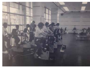
栄公会堂・栄スポーツセンター