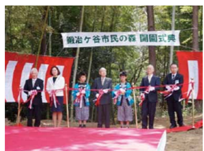
鍛冶ヶ谷市民の森

最初の市民の森である「飯島市民の森」開園(4月)。「上郷市民の森」開園(10月)。 市町村制施行により、鎌倉郡本郷村(笠間、小菅ヶ谷、公田、桂、中野、鍛冶ヶ谷、上野)、 豊田村(飯島、長沼、下倉田、上倉田)、長尾村(金井、田谷、長尾台、小雀)誕生。 本郷、豊田など近接町村が横浜市に合併、戸塚区誕生。