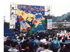
さかえステップカーニバル