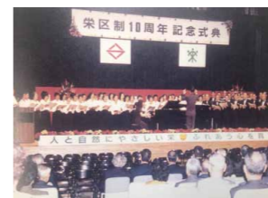
栄区制10周年記念式典