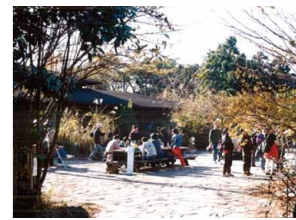
横浜自然観察の森