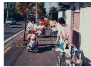
知的障害者通所更生施設「朋」