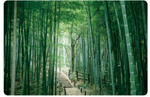
本郷ふじやま公園