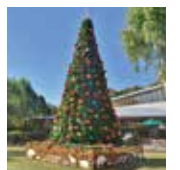
※画像は昨年のものでした。