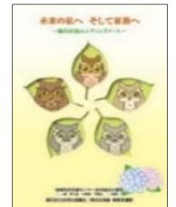
エンディングノート