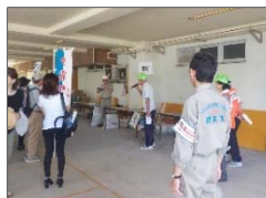
地域防災拠点における訓練