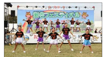
瀬谷フェスティバル（2019年）