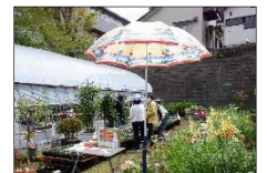
オープンガーデン