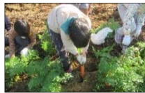
せやっこわくわくワーク