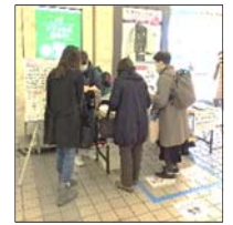
福祉事業所の製品販売