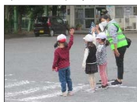
はまっこ交通安全教室