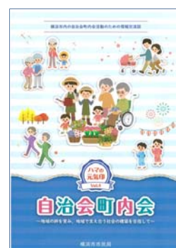
情報交流誌 vol.4（28年度発行）

自治会町内会相互の情報共有を図るため、加入促進や活性化の先進的な事例を掲載する「ハマの元気印 自治会町内会情報交流誌」を発行 （3月予定）