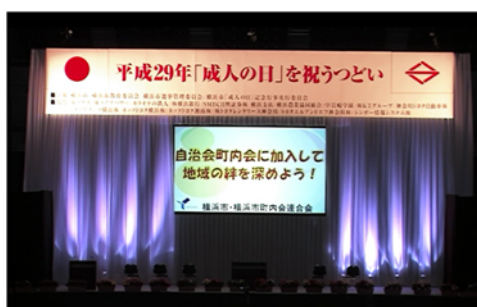
成人の日を祝うつどいでのPR（H29.1月開催時）