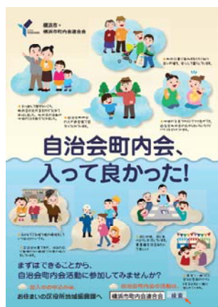
加入促進ポスター