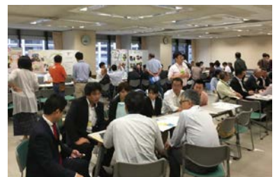
企業マッチング会の様子