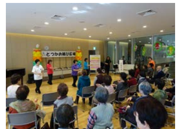
第7回とつかお結び広場

戸塚区内を中心に様々な分野で活動している地域活動団体や個人の活動内容を、パネル・活動体験・ステージパフォーマンス等を通して紹介するイベントを開催しました。企画・運営は公募で集まった運営委員の方々により行われ、来場者に地域活動への参加のきっかけを作ることや、活動団体同士の交流につながりました。