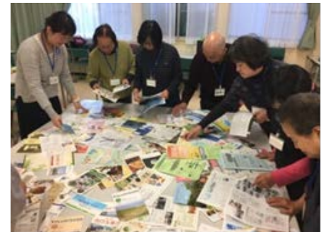
団体カスキルアップ講座 「心に届く広報紙の作り方」

⇒子育て支援拠点こっころ・区社会福祉協議会と3者連携で子育て応援講演会「日本の子どもたちはいま」（全2回）を実施しました。また、区内施設間連携促進及び地域支援の拡充を目的とした、区内施設職員・行政職員向け研修（全2回）を実施しました。