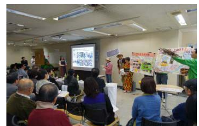
二次コンテスト発表の様子