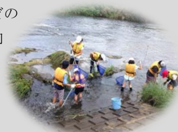
(一般向け講座 「慶應の森の探検隊」)

【効果】互いの持つ情報等を出し合い企画や広報を検討することで、自然の魅力を感じながら身近な防災について学ぶ一般向け講座を新たに行うなど、対象者の興味に合わせた事業を効果的・効率的に実施することができました。