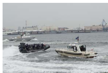
テロ対策訓練：海上