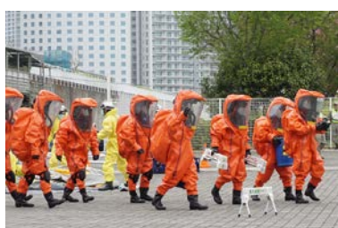
テロ対策訓練：陸上