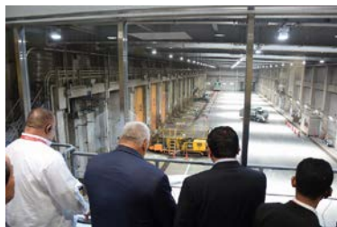
VIPテクニカルツアー