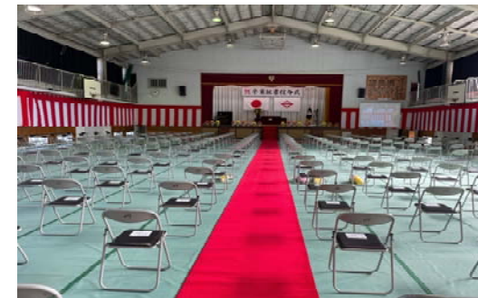
中学校卒業式の様子