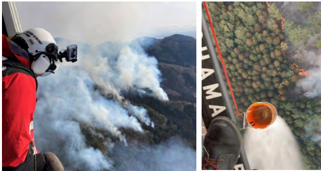
①ヘリコプターによる空中消火活動