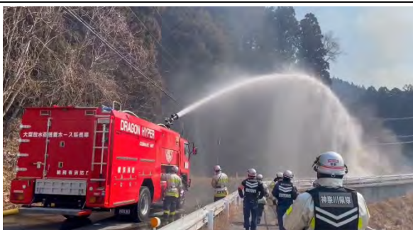
⑤大量放水による消火活動