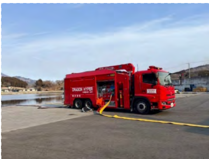
③漁港にて海水を取水