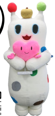
戸塚区マスコット 『ウナシー』