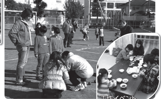
スポーツイベント

川上地区では毎年12月にスポーツ推進委員と協働でイベントを開催します。午前は「スポーツ」、昼食に「トン汁」を食べてから午後は「工作」とフルコースです。昨年は「ペタンク大会」と「アイロンビーズ作り」を行いました。スポーツの得意な子、アート感覚に優れた子、それぞれが自分の個性を發揮し輝く一日です。