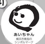
あいちゃん 横浜市青指の シンボルマーク