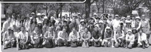
さわやかウォーク「保土ヶ谷めぐり」