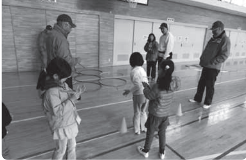
毎年2月に30~40人で楽しみます

ある程度形になった羽根の部分を紙やすりできれいにしながら、左右のバランスを調整し、竹串の軸を付けます。そして、マジックで色を塗って自分だけの竹とんぼを完成させます。その後体育館で、飛んだ距離と、フラフープの輪に入れるという二つのゲームを遊びます。自分だけの竹とんぼで、高く遠くまで飛ばそうと、何回も挑戦し見上げる目が、とても楽しそうです。