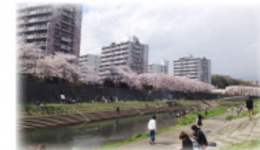
吉田大橋近くの広場