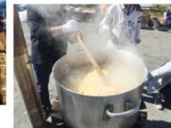
大鍋でつくる豚汁は最高!