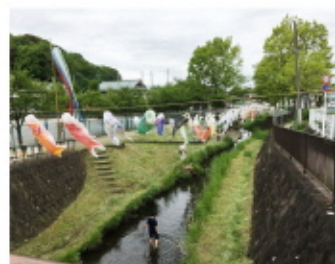
優雅に泳ぐ鯉のぼり!

毎年GW期間中、大小合わせて何百もの鯉のぼりを春の舞岡川に泳がせています。また遊水池公園内では露天での販売や、舞岡中学校吹奏楽部の演奏会など、楽しいイベントが盛りだくさんです。