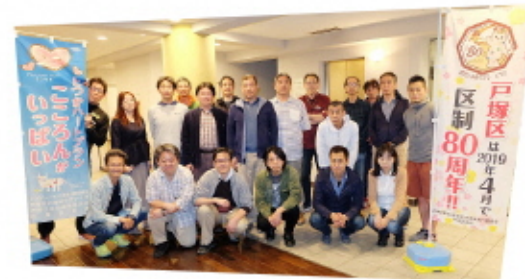
吉田矢部地区のメンバー