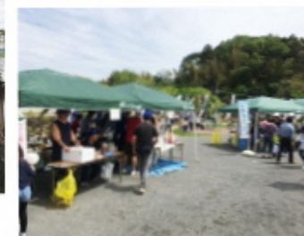
今年は焼きそばを販売!