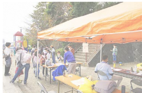
▲イベント当日の様子