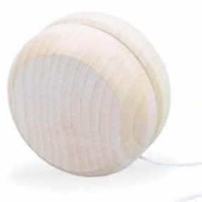
▲2018年 ヨーヨー 工作キットに着色、描画