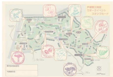
▲スタンプカードでチェック