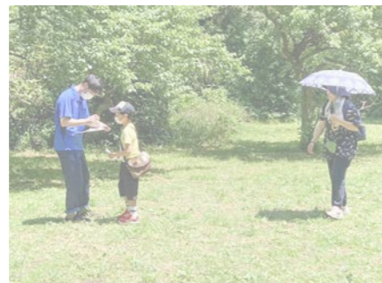
▲ウォーキングの様子