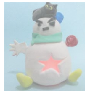
▲2016年 クリスマスランタン 紙粘土で造形