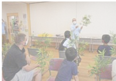
▲七夕飾り制作イベント

作った飾りは参加者が持ち帰って七夕まで飾ります。皆さんいろいろな願い事を短冊に書いています。