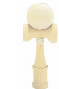
▲2019年 けん玉 工作キットに着色、描画