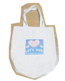
▲参加賞のエコバック