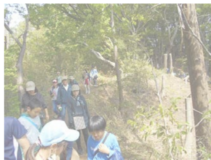
▲ウォーキングの様子