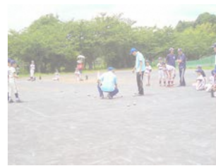
▲少年少女スポーツ大会

スポーツ推進委員と合同で、ヨーロッパで人気の「ペタンク」を体験します。なじみの少ないスポーツですが、みんな熱中しています。