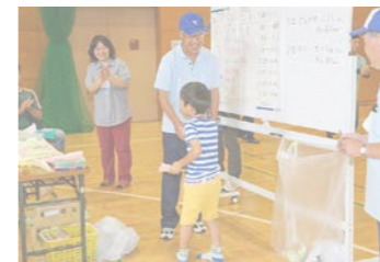
▲ちびっこ工作教室

牛乳パックの紙ヒコーキや折り紙手裏剣や割りばし鉄砲など、身近なものを材料にし、すぐに遊べるものを自分で作る工作教室です。作った後は競技会で勝負!