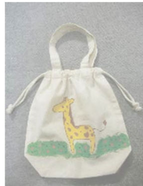
▲2021年 無地の巾着に描画