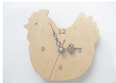
▲2017年 とけい 工作キットに着色、描画