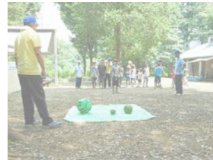
▲わんぱくサタデー

夏休みにミニキャンプ!薪割りから食材の下ごしらえ、火起こしなどを体験し、自分で作ったカレーを食べます。食事の後はスイカ割りやミニゲームで盛り上がりします。