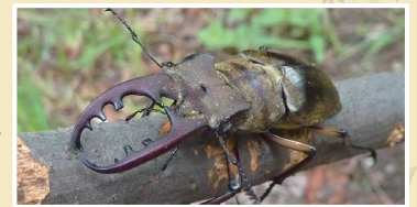
▲園内で保全しているミヤマクワガタ